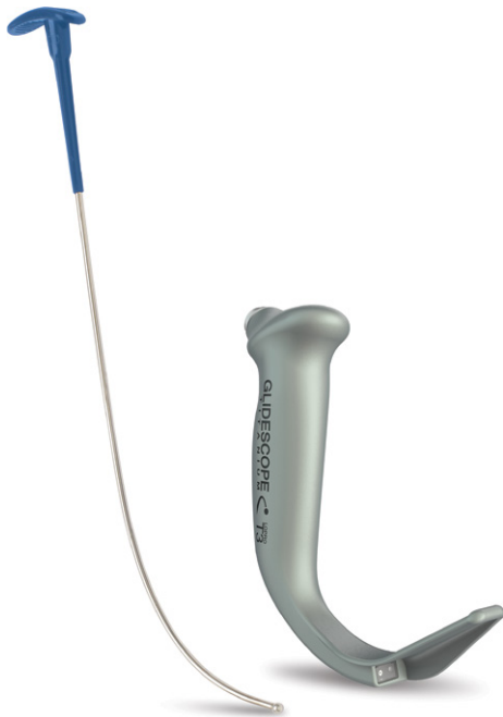
Bild 1. GlideRite styv mandräng och GlideScope Titanium återanvändbart videolaryngoskop

GlideRite styv mandräng är specifikt utformad för att användas tillsammans med GlideScope-videolaryngoskop. GlideRite-mandrängens vinkel passar tillsammans GlideScope-instrumentets unika vinkel vilket underlättar snabb placering av en endotrakealtub och minskar patientens trauma.